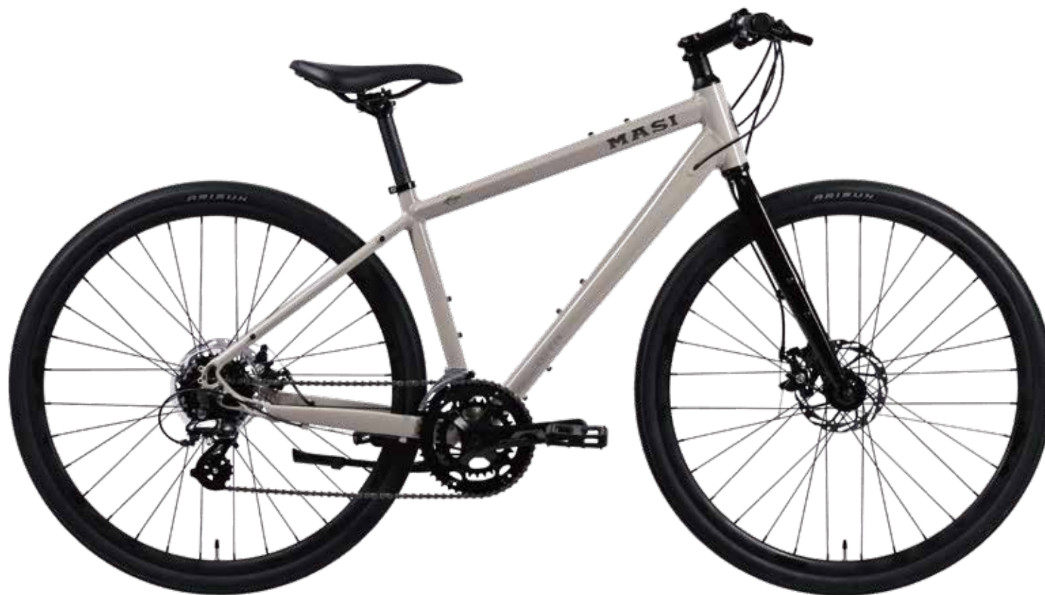
Beige (S size)