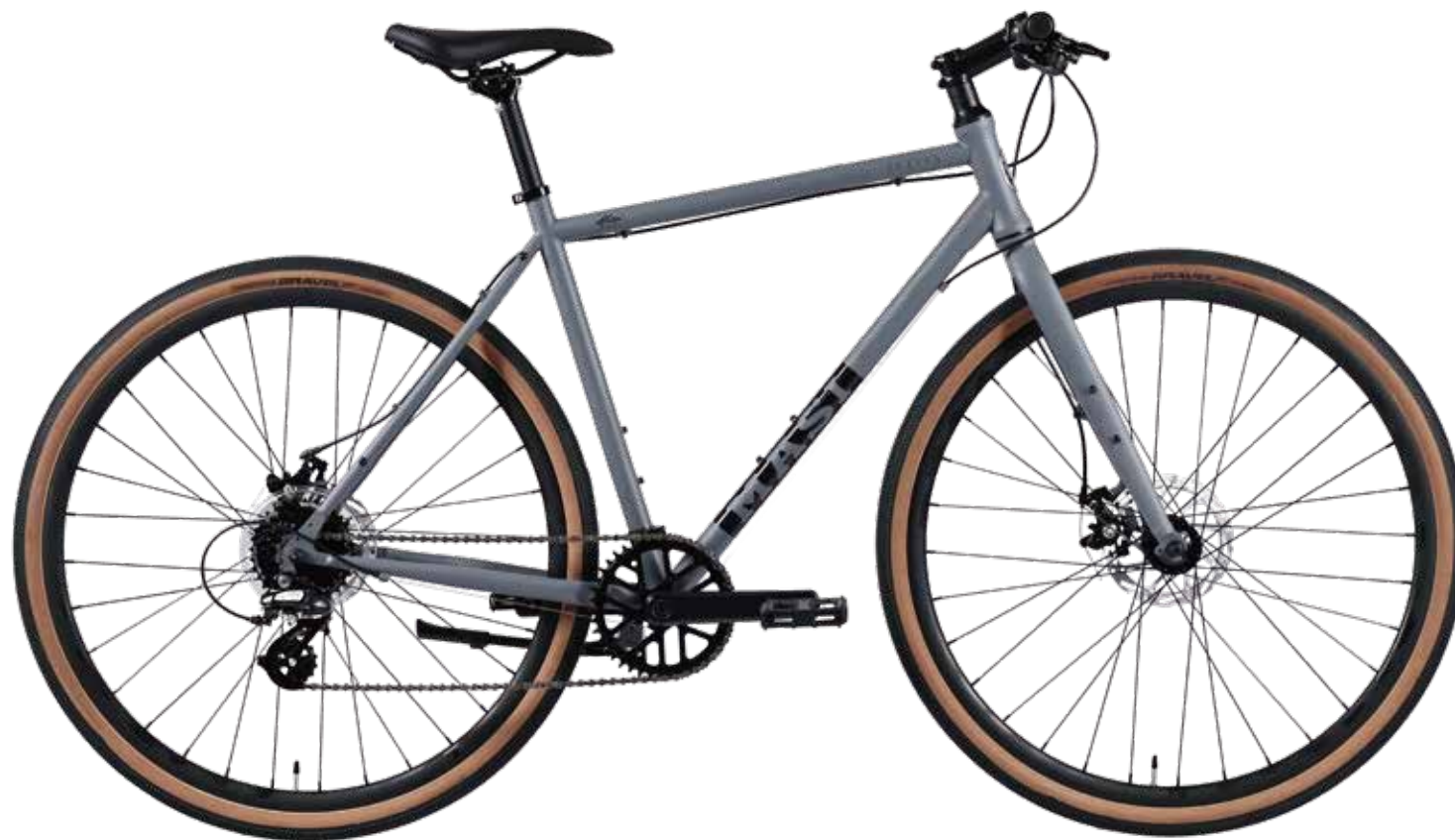
Grey (M / L size)