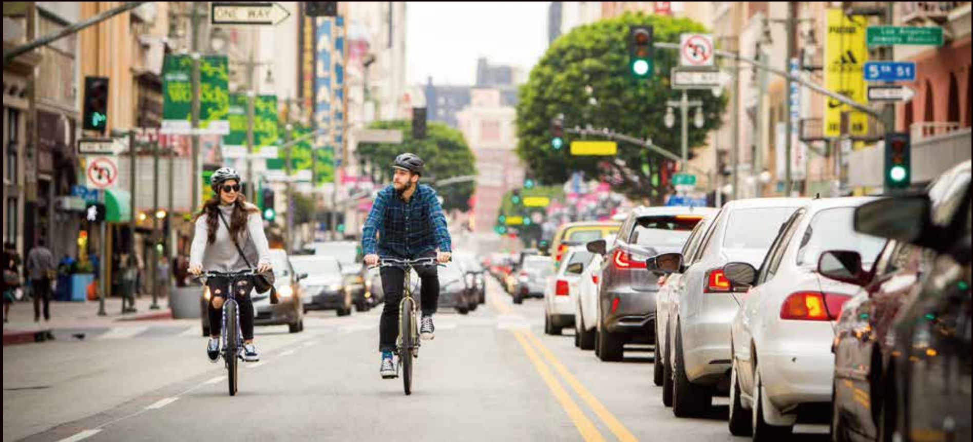
URBAN COMMUTER BIKE