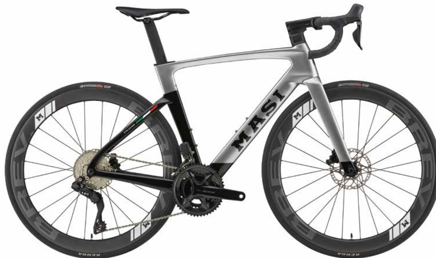
Gloss Silver / Black