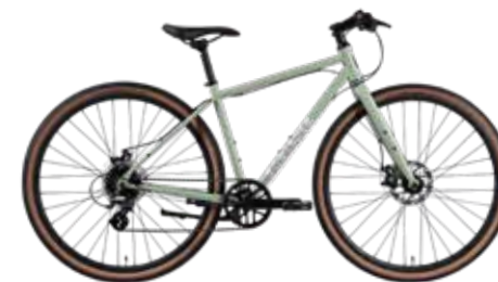
Green (S size)