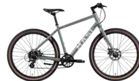
Olive (S / M / L size)