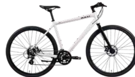
White (M / L size)