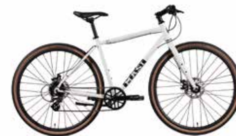
White (S / M / L size)