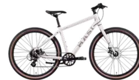
Beige (S size)