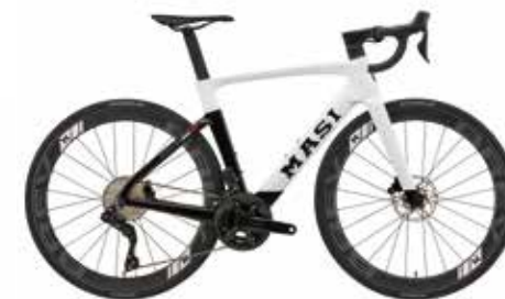
Gloss White / Black