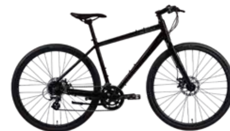
Black (S / M / L size)