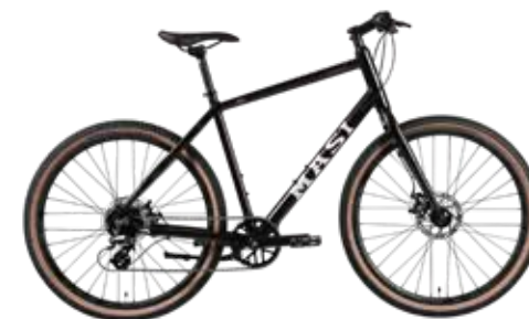
Black (M / L size)