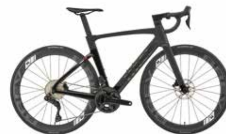
Matte Black / Black