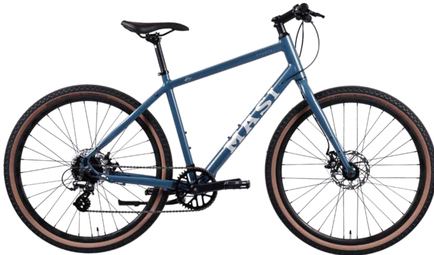
Blue (M / L size)